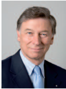
Gerold Bühler Nationalrat, Präsident economicsuisse