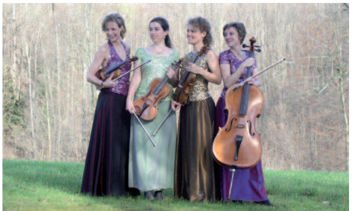
le donne virtuose

Anmeldung unter www.asco-consultingday.ch bis 1. September 2007